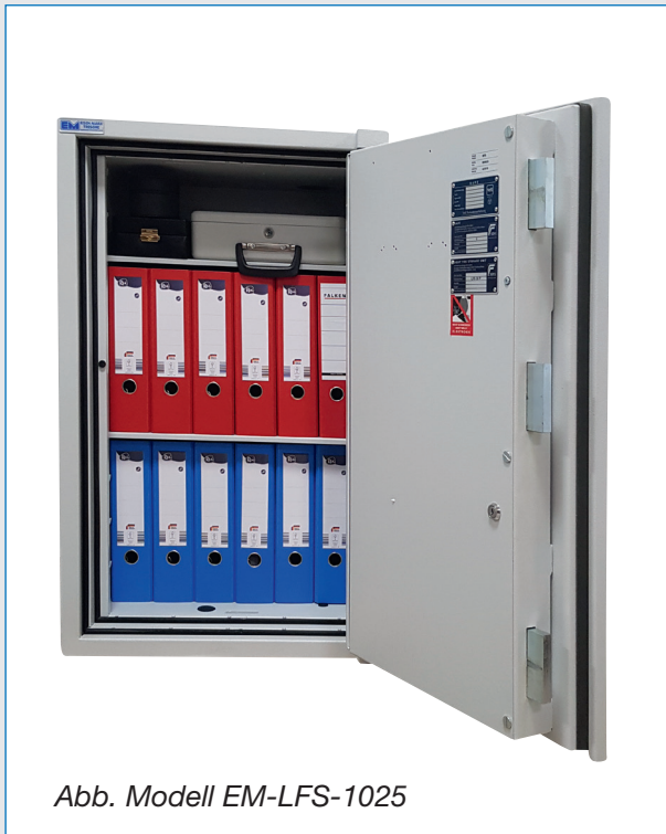
Abb. Modell EM-LFS-1025